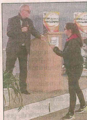
CÉRÉMONIE. Lors de la remise des diplômes.